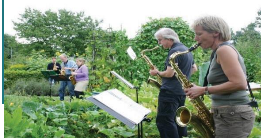
Resim 8 – Sebze parselinde müzik gösterisi, Langemarck parsel bahçeleri, Münster, Almanya.