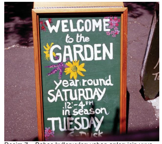
Resim 7 – Bahçe kullanıcıları yaban arıları için yuva yerleri sağlıyor.