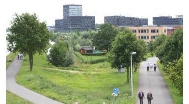
Fotoğraflar 9 & 10: Parsel bahçesi, "Park Groenewoud" Utrecht, Hollanda.