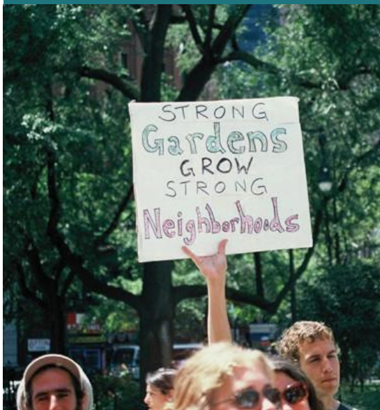
Resim 4 – New York'ta topluluk bahçelerinin yıkımına karşı protestocular gösteri düzenliyor.