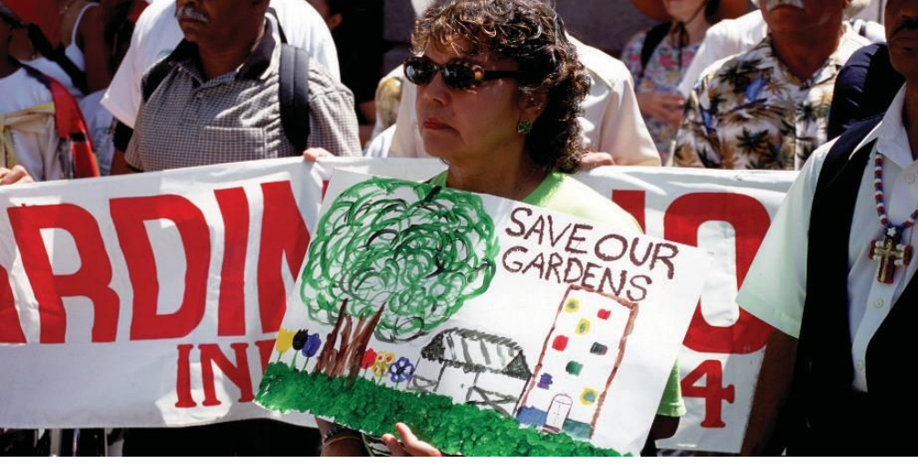
Resim 6 – Bangladeşli kadınlar bahçe parsellerini hazırlıyor, Ipswich, Birleşik Krallık