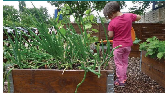
Resim 5 – Genç bahçe kullanıcıları faaliyette.