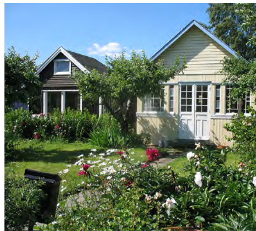
Kuva 5 - Etterstadin siirtolapuutarha, Oslo, Norja.