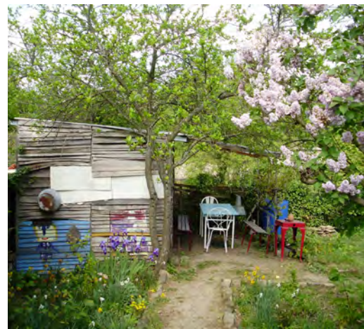
Kuva 3 - Perinteinen perhepuutarha.