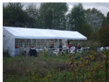
Kuvat 6 & 7 - Jardins des Bordes - Kaava ja valokuva.