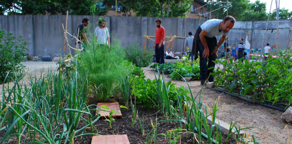
Kuva 2 - Pla Buits kaupunkiviljelmä, Barcelona.