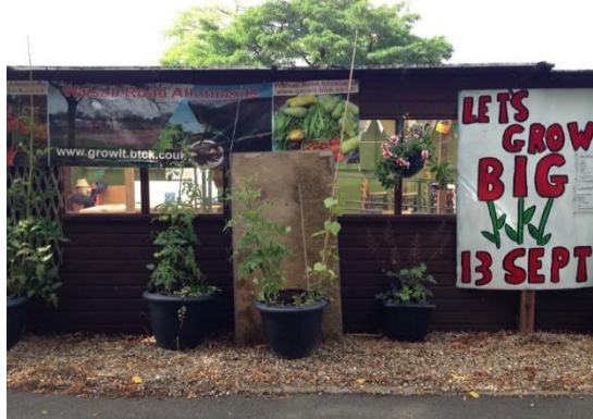
Resim7 –Sosyal etkinlikler ve ortak aktiviteler için ortak mekan sunan, Walsall Road Parseli.