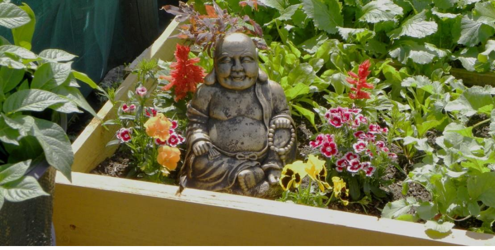
Resim 2 –Parselleri kişiselleştirmek, Weaver’s Square Parselleri ve Topluluk Bahçesi, Dublin.