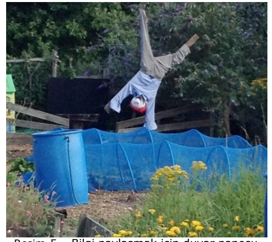
Resim 5 – Bilgi paylaşmak için duvar panosu, Edible Eastside, Birmingham.