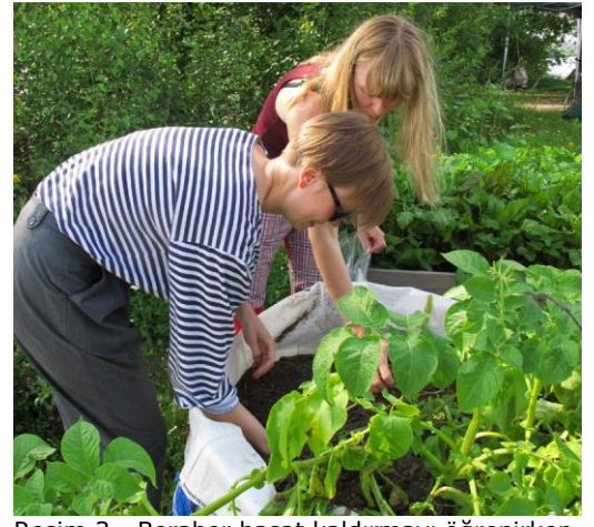
Resim 3 - Beraber hasat kaldırmayı öğrenirken, Tampere, Finlandiya.