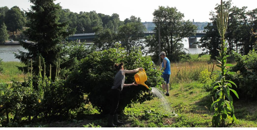
Resim 2 - Mustikkamaa Edible Park'ta bir toplama esnasında bahçeler sulanırken, Helsinki, Finlandiya.