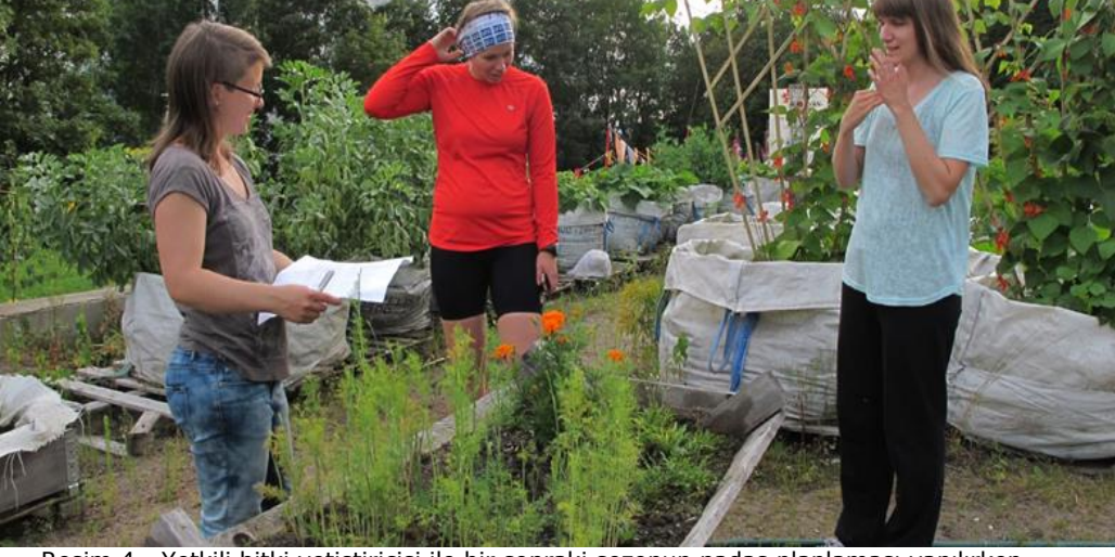
Resim 4 - Yetkili bitki yetiştiricisi ile bir sonraki sezonun nadas planlaması yapılırken. Kalevanharju Umumi Bahçesi, Tampere, Finlandiya.