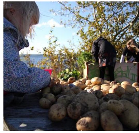
Resim 5 - Çocuk patates hakkında bilgi alırken. Tampere, Finlandiya.